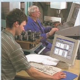
Programmierung einer CNC-Fräsmaschine